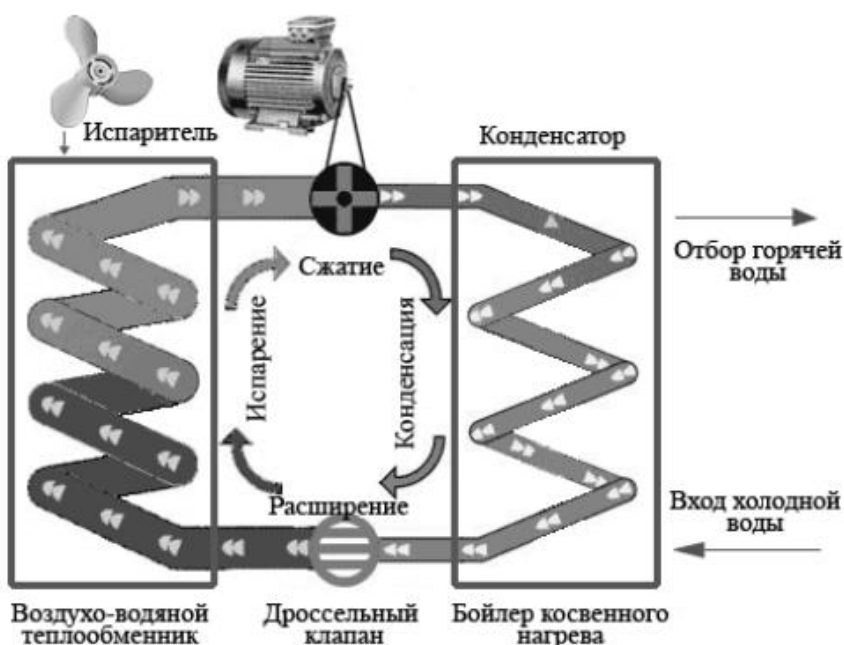
Рис.1. Принцип действия теплового насоса

б) нетрадиционные возобновляемые источники энергии: теплота окружающего воздуха; теплота грунтовых вод; теплота водоемов и природных водных потоков; теплота солнечной энергии; теплота поверхностных слоев грунта.