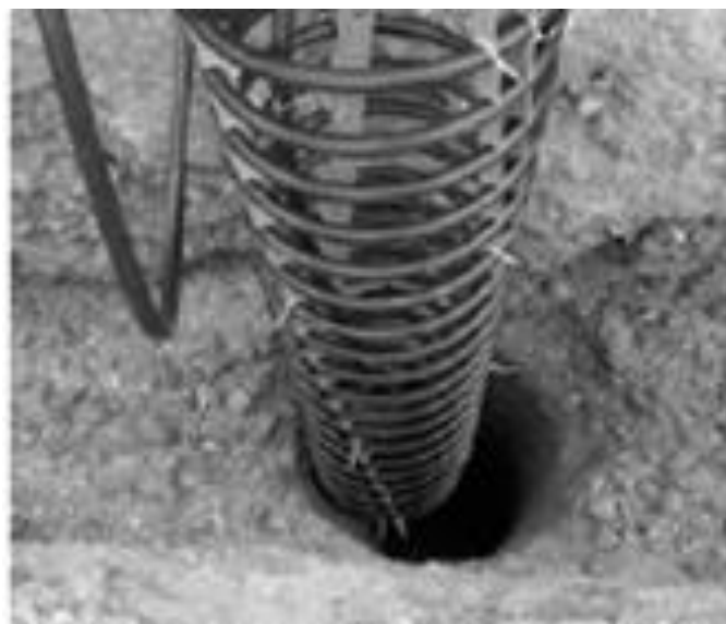
Рис. 4. Схема размещения коллектора для вертикальных геотермальных тепловых насосов

Преимущества и недостатки тепловых насосов. Главным достоинством тепловых насосов являются их низкие эксплуатационные расходы, т.е. стоимость произведенного тепла или охлаждения для конечного потребителя является самой низкой по сравнению с другими способами отопления или кондиционирования. Кроме этого, система с тепловым насосом практически безопасна для дома. Следовательно, упрощаются требования к системам вентиляции его помещений и повышается уровень пожарной безопасности.