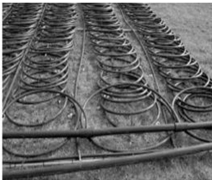
Рис. 3. Схема размещения коллектора для горизонтальных геотермальных тепловых насосов