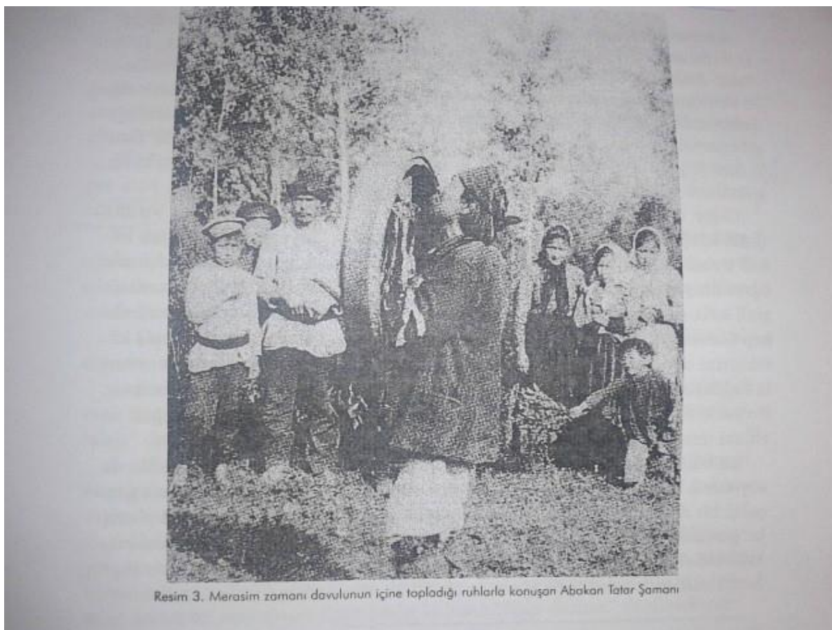
Resim 3. Merasim zamonı davulunun içine topladıđı ruhlarla konuřan Abakan Tatar řamanı