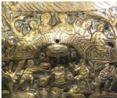
Seusoning tarqalishi Lakus Pelso (Balaton ko'li)

nazaridan, faqat ijtimoiy piramidaga cho'qqilar qo'shildi. Shaxsiy munosabatlar — homiylik, do'stlik (amisiya), oila, nikoh respublikada bo'lgani kabi siyosat va hukumat faoliyatiga ta'sir ko'rsatishda davom etdi. Ammo Neron davrida, erkin tug'ilgan fuqarodan ko'ra boyroq bo'lgan yoki senatoridan ko'ra ko'proq hokimiyatni egallagan otliqni topish odatiy hol bo'lmagan.