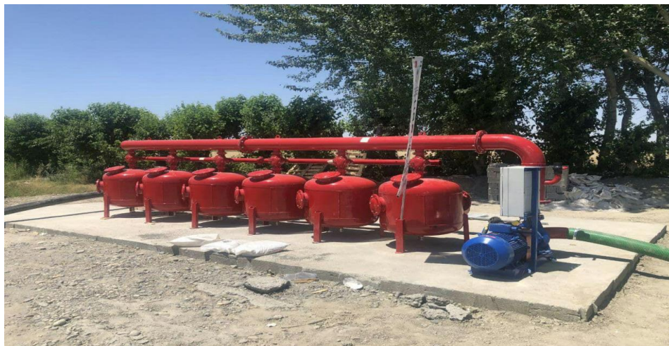
1-rasm. Suv tejevchi texnologiyalar

bog'liq bajariladigan va bajarilishi lozim bo'lgan ishlar bilan shaxsan Bosh Vazir shug'ullanadi va nazorat olib boradi. Turkiyada qishloq xo'jaligi ekinlarini sug'orish maqsadlarida ishlatiladigan suvga to'lovlar bo'yicha mahalliy sharoit hisobga olingan mexanizm ishlab chiqilgan.