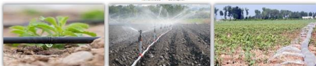
2-rasm. 5 yil davomida joriy qilingan suv tejevchi texnologiyalar dinamikasi

Ushbu rasmdan ham ko'rinib turibdiki, mamlakatimiz qishloq xo'jaligida suvtejamkor texnologiyalarni qo'llash samaradorligi va 2025 yilgacha bo'lgan prognoz ko'rsatkichlari keltirilgan bo'lib, bugungi global iqlim o'zgarishi va suv tanqisligi sharoitida sug'orishning suvtejamkor texnologiyalarni qo'llash davr talabi ekanligini ko'rsatmoqda.