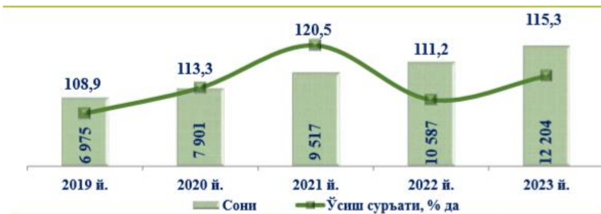
1-расм. 1 январь ҳолатига кўра ахборот ва алоқа соҳасида

Республикаимизнинг хизматлар кўрсатиш соҳасида алоқа ва ахборотлаштириш хизматларининг улуши йилдан-йилга ўсиб бормоқда. Ўзбекистон Республикаси Президенти ҳузуридаги Статистика агентлиги маълумотлари кўрсатишича алоқа ижтимоий ва ишлаб чиқариш инфратузилмасига тегишли бўлсада, у миллий иқтисодиётда катта роль ўйнайди. Алоқа соҳаси иқтисодий тизимнинг шундай таркибий қисмидирки, уларсиз ишлаб чиқариш жараёнларининг нормал ишлаши, шунингдек, аҳолининг ҳаётининг фаолиятини тасаввур қилиб бўлмайди. Алоқа деганда аҳолининг ижтимоий ва иқтисодий ҳаётининг инфратузилма таркибий қисми, шунингдек, ахборотлаштириш жараёнлари тушунилади. 2023 йилнинг 1 январь ҳолатига кўра, ахборот ва алоқа иқтисодий фаолият турида 12 204 та корхона ва ташкилотлар (деҳқон ва фермер хўжаликларидан ташқари) фаолият кўрсатмоқда. 2021 йилнинг мос даврига нисбатан уларнинг сони 1 617 тага кўпайиб, 15,3 % га ўсган.