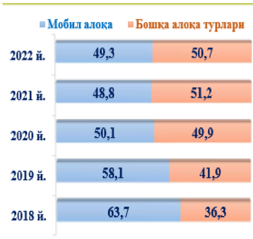
4-расм. Алоқа хизматлари таркиби (% да) 4

аҳолига кўрсатилгани 7 295,3 млрд. сўмни ташкил этди.