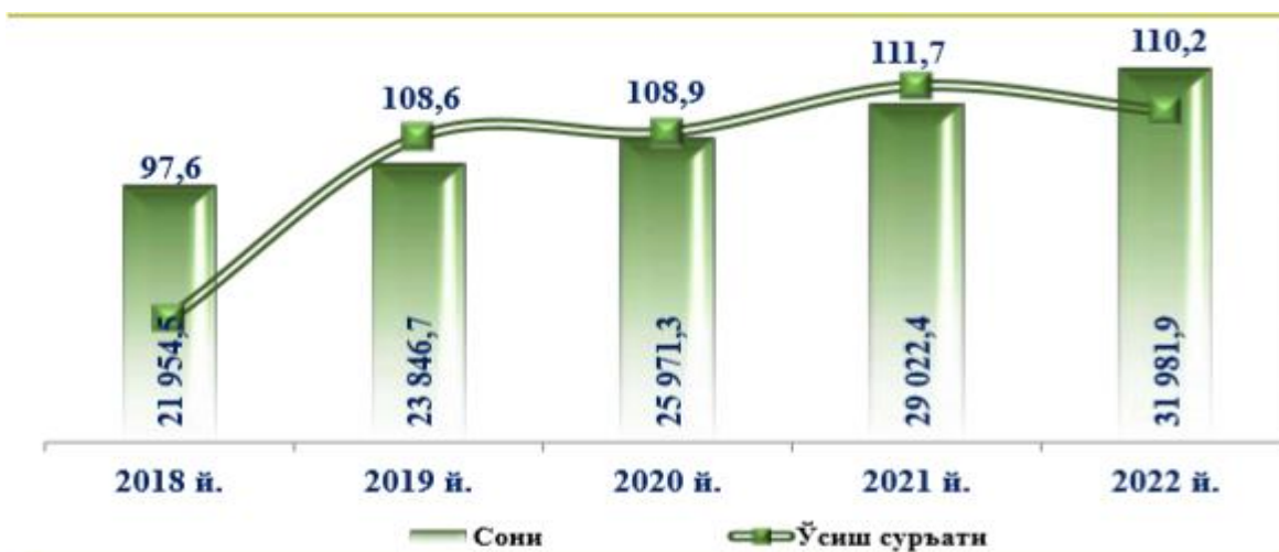
5-расм. Ўзбекистон Республикаси бўйича мобил алоқа абонентлари сони (йил охирига, минг абонент) 5

Сўнгги йиллар давомида уяли алоқа абонентлари сони фақат ўсиб борган ва таҳлил қилинаётган йиллардаги юқори ўсиш суръатлари 2021 йилда қайд этилган (111,7 %).