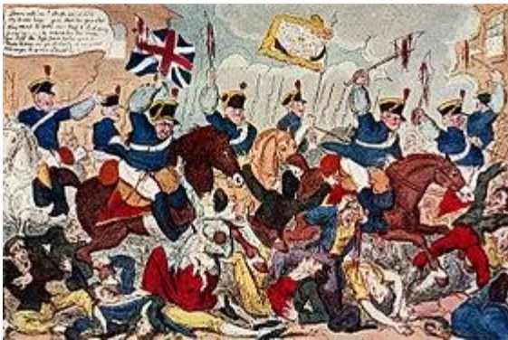
Jorj Kruikshankning mitingdagi ayblovni aks ettirgan karikaturasi

O'n daqiqa ichida olomon tarqaldi, 11 kishi halok bo'ldi va 600 dan ortiq kishi jarohat oldi. Faqat yaradorlar, ularning yordamchilari va o'liklari qoldi; yaqinida yashovchi bir ayol "juda ko'p qon" ko'rganini aytdi. Keyinroq bir muncha vaqt ko'chalarda tartibsizliklar bo'lib o'tdi, eng jiddiyi Nyu Xochda, qo'shinlar islohotchi ayollardan birini esdalik sifatida olib ketishgan, mish-mishlarga ko'ra kimgadir tegishli do'konga hujum qilgan olomonga qarata o'q uzgan. Ertasi kuni ertalabgacha Manchesterda tinchlik o'rnatilmadi va Stokport va Makklesfildda 17-da ham tartibsizliklar davom etdi. O'sha kuni Oldxemda ham katta g'alayon bo'lib, bir kishi otib yaralangan edi.