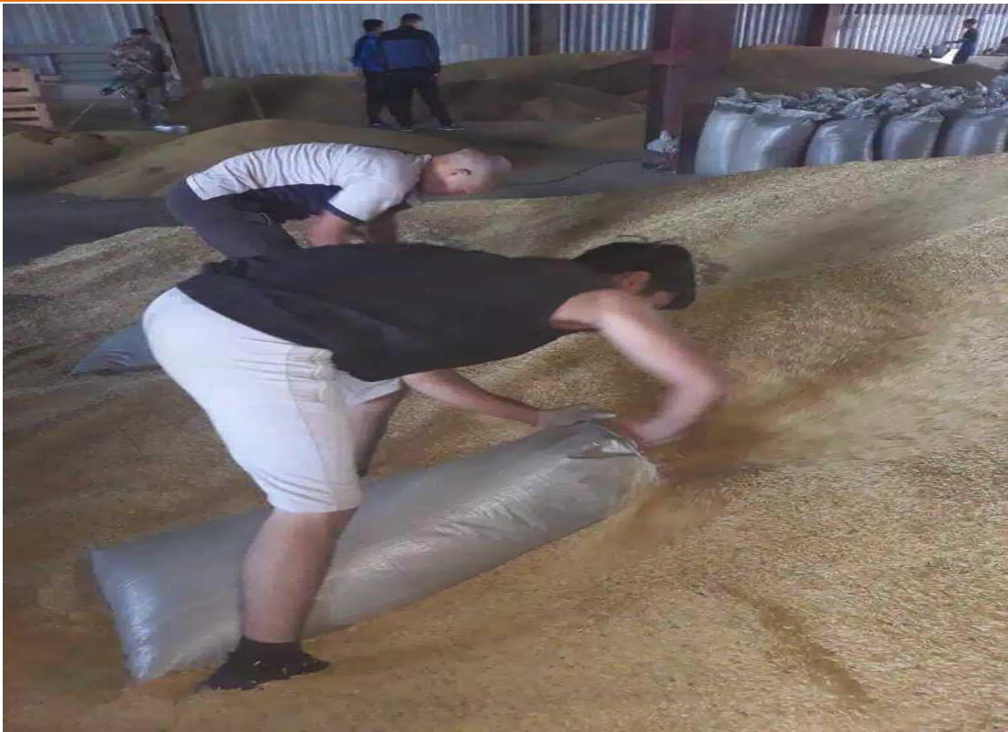
1-расм. Қўл меҳнати билан Афғонистонга мўлжалланган толлингги сулини қоплатиш.