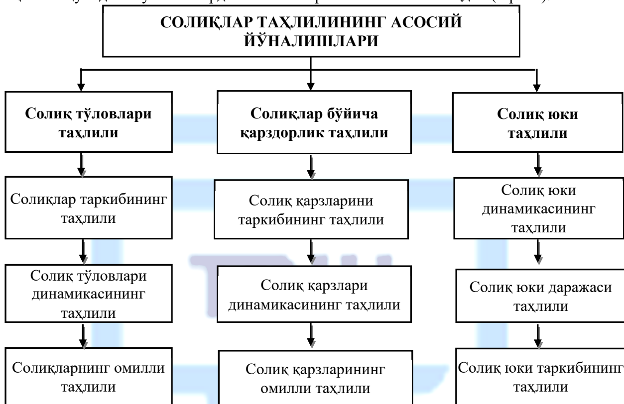
1-расм. Солиқлар таҳлилининг асосий йўналишлари 1 .

Юқорида келтирилган солиқлар бўйича харажатлар таркибини аниқ шакллантириб олганимиздан кейин, солиқлар таҳлилини такомиллаштириш мақсадида таҳлилни қуйидаги йўналишларда амалга оширилишини ишлаб чиқдик (1-расм):