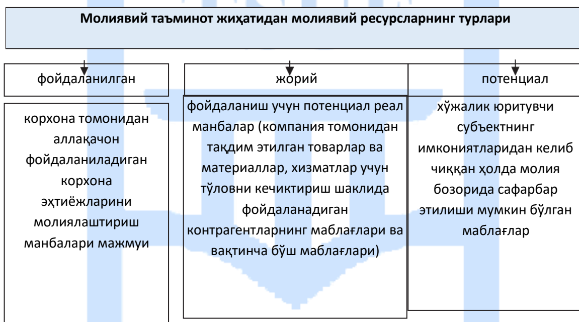
1-расм. Хўжалик юритувчи субъектлар молиявий ресурсларининг турлари

Масалан, А.Н.Гаврилова ва ҳаммуаллифлар таъкидлашича, «капитал (ўз маблағлари, соф активлар) корхонанинг мажбуриятлардан холи мулки, унинг ривожланиши учун шарт-шароит яратувчи стратегик захирадир...».