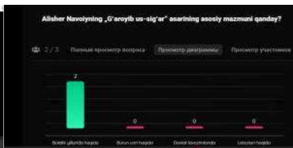
6-rasm. Savollarga beerilgan javoblar