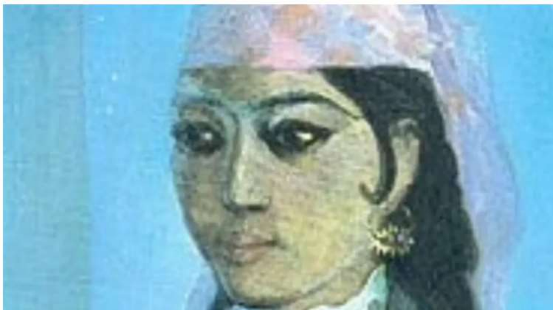
1-rasm. Anbar Otin

Ayol ijodkorlar orasida Anbar Otin Nodiradan keying davrning yorqin adabiy siymosidir. Uning asarlarida milliy ongni uyg'otish, jamiyatni tarqqiyotga undash, o'z xalqini boshqa davlatlar bilan solishtirgan holda ilg'or davlatlarga tenglashgan da'vat g'oyalari yoniq so'z bilan tashviq qilingan.