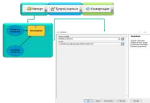
2-rasm. ModelBuilder da dala tadqiqot ishlarini geoma'lumotlar bazasiga konvertatsiya qilish tizimini avtomatlashtirish algoritmi

algoritmash ishlari olib boriladi. Algoritmash ishlarini amalga oshirishda buyruqlar ketma-ketligi dasturning qoidalari asosida belgilanib, mavzuli qatlamlar va ArcToolbox panelidagi instrumentlardan foydalanish asosida modullashtiriladi. Modullashtirishni amalga oshirish uchun dastlab dala tadqiqot ishlarini yuritish tizimi avtomatlashtirilishi talab etiladi. Dala tadqiqot ishlarini avtomatlashtirishda, geoaxborot tizimi oilasiga mansub bo‘lgan ArcGIS dasturiy ta’minotida yaratilgan elektron raqamli kartalar asos sifatida xizmat qiladi.