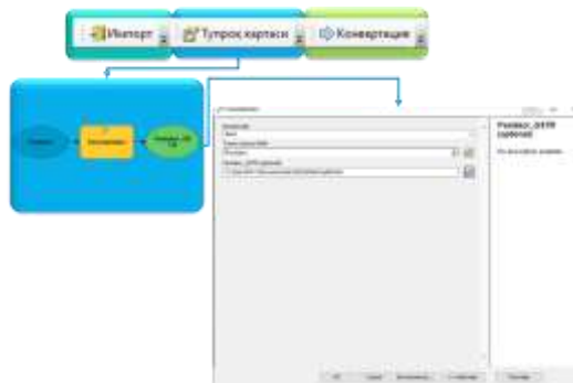
3-rasm. ModelBuilder da tuproq ayirmalarini geoma'lumotlar bazasida vizuallashtirish tizimini avtomatlashtirish algoritmi